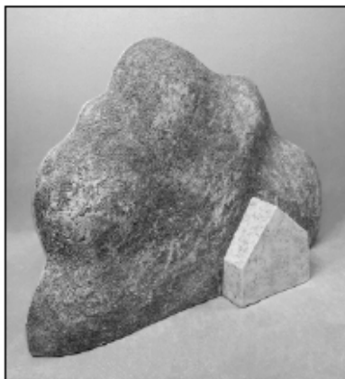
Eugenijaus Čibinsko „Jrigręs“.