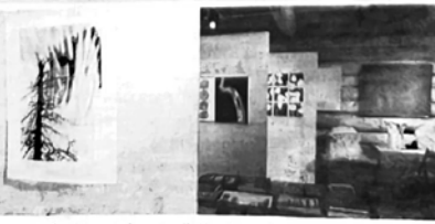
Galerija atidaryta šeštadienį ir sekmadienį nuo 10 iki 18 val. arba iš anksto susitarus (8 621 47966).