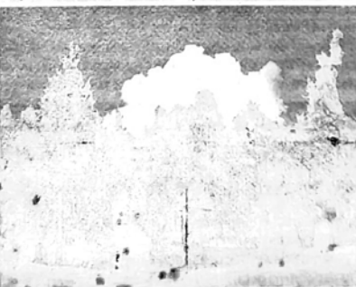
Vladas Oržekauskas. Pamiškė, 2024